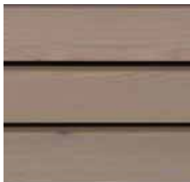
Farbton Nr. 4863