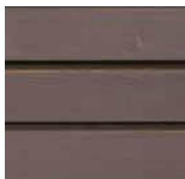
Farbton Nr. 4470-M