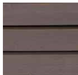
Farbton Nr. 4832-M