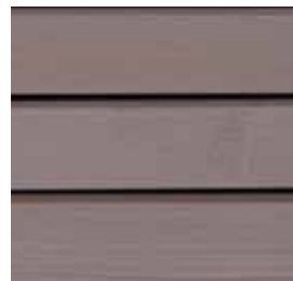
Farbton Nr. 4875