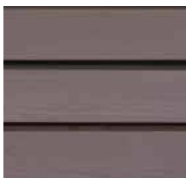
Farbton Nr. 4259-M