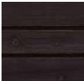
Farbton Nr. 4890