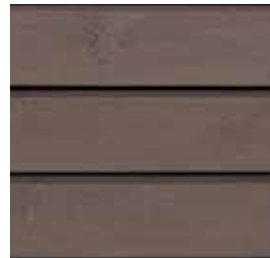
Farbton Nr. 4832