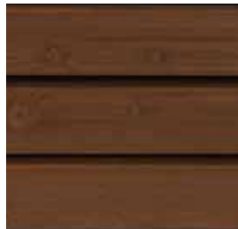
Farbton Nr. 4735