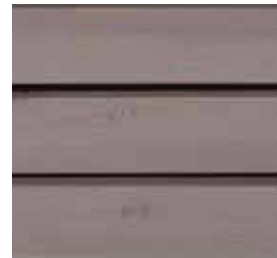
Farbton Nr. 4861