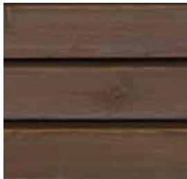
Farbton Nr. 4470