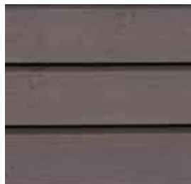
Farbton Nr. 4870