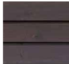
Farbton Nr. 4880