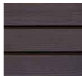
Farbton Nr. 4890-M